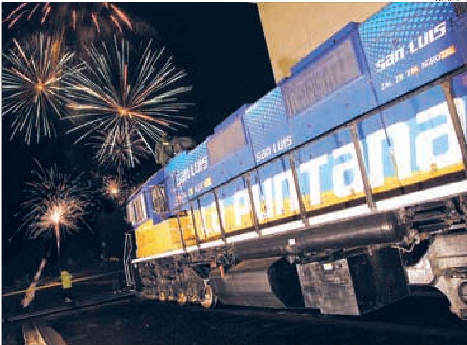
NOCHE ENCENDIDA. LOS FUEGOS ARTIFICIALES RECIBIERON A LA PUNTANA. EL PÚBLICO ESPERA QUE SU LLEGADA SEA EL COMIENZO DE UNA NUEVA ERA.

La Zona Estación volvió a vivir. Esperan que éste sea el puntapié para la vuelta de los trenes.