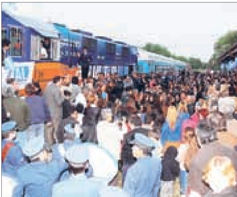
PRIMERA PARADA. EN MERCEDES LA MÁQUINA ARRANCÓ LÁGRIMAS.

La llegada fue anunciada por los bocinazos del tren, ésos que antes eran moneda corriente, y los